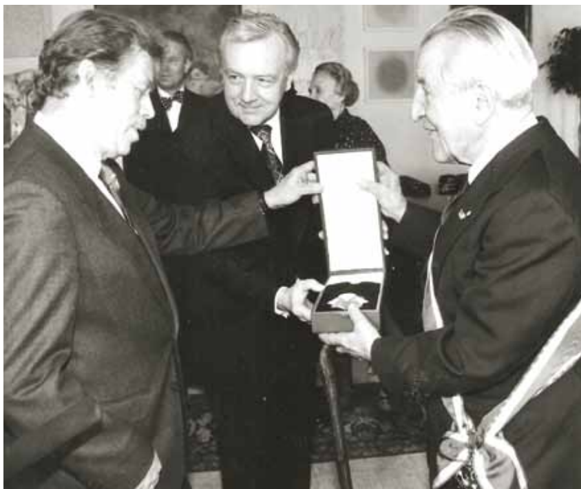
Obr. 5: Udělení Řádu bílého lva Václavem Havlem, 1990.